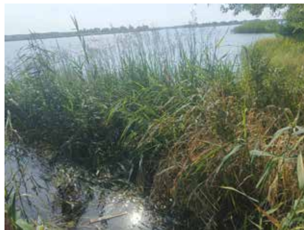
Рисунок 9. Заросли тростника, рогоза, камыша Figure 9. Thickets of reeds, cattails, and reeds

Фитофилами являются: язь ( L. idus Linnaeus, 1758), линь ( T. tinca Linnaeus, 1758), верховка ( L. delineates Heckel, 1843), уклея ( A. alburnus Linnaeus, 1758), синец ( B. ballerus Linnaeus, 1758), лещ ( A. brama Linnaeus, 1758), плотва