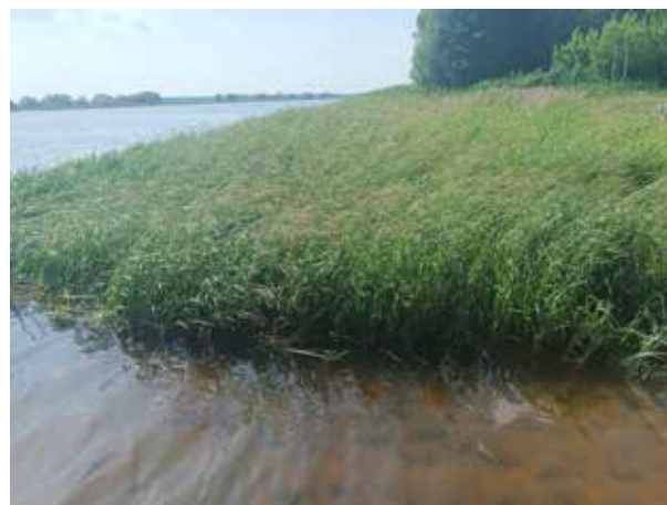
Рисунок 8. Монодоминантные заросли тростника в устье реки Городня

Количество групп бентоса от периода к периоду изменяется незначительно и не опускается ниже 10 из 14, встреченных за весь сезон. Доминирующими группами организмов на протяжении года являлись личинки хироно-