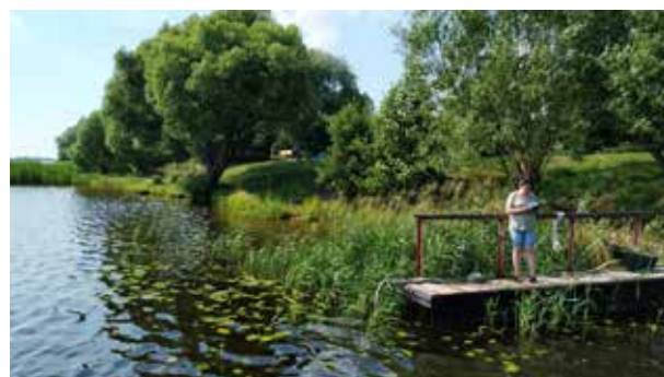
Рисунок 10. Заросли плавающих гидрофитов (кубышка и стрелолист) Figure 10. Thickets of floating hydrophytes (potbelly and arrowhead)

( R. rutilus Linnaeus, 1758), густера ( B. bjoerkna Linnaeus, 1758), карась серебряный ( C. gibelio , Bloch, 1782), красноперка ( S. erythrophthalmus Linnaeus, 1758) сом обыкновенный ( S. glanis Linnaeus, 1758), судак ( S. lucioperca Linnaeus, 1758), щука ( E. lucius Linnaeus, 1758), окунь обыкновенный ( P. fluviatilis Linnaeus, 1758).