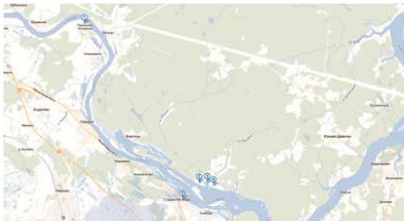
Рисунок 3. Места отбора проб на Волжском плесе: 1-п. Игуменка; 2-д. Единоново; 3-Единоновский затон; 4- д. Единоновские Горки; 5-Старомелковское с/п.

Figure 3. Sampling sites on the Volga plain: 1-point. The Abbess; 2-Edimonovo village; 3-Edimonovsky zaton; 4- D. Edimonovsky Hills; 5-Staromelkovskoe village