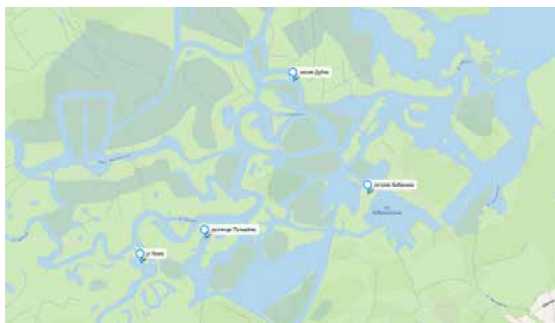
Рисунок 2. Места отбора проб на Шошинском плесе Figure 2. Sampling sites on the Shoshinsky Ples