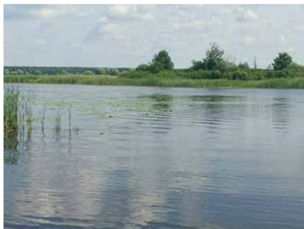
Рисунок 7. Зарастаемость гидрофитами Figure 7. Overgrowth by hydrophytes

Рассчитанный коэффициент видового сходства зоопирофитона по Чекановскому-Серенсену в зарослях монодоминантных растений также указывает на большие различия. Между рогозовыми и рдестовыми зарослями коэффициент составил 0,31, между рдестовыми и из телореза – 0, 12.