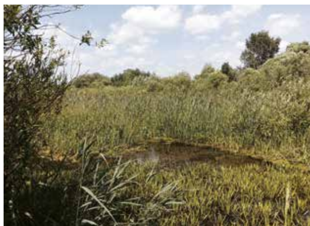
Рисунок 4. Заросли тростника, рогоза и телореза Figure 4. Thickets of reeds, cattails and thalassia

не более 1,2 метра. Правый берег зарос ивняком и ивами, его низинная часть образует отдельные сплавины и береговые заболоченные участки. У уреза воды располагались заросли водно-болотных растений: тростник обыкновенный, манник водяной, камыш озерный, двукисточник тростниковый, рогоз узколистный. На глубине от 0,5 до 0,8 м росли: рдест плавающий, кубышка желтая, водяной орех. В устье от берегов отмечали: камыш, тростник, тростниковый двукисточник, а вся площадь в летнее время покрывается погружной и полупогружной водной растительностью: рдестом, телорезом и урутью, оставляя не заросшей неширокую глубинную часть.