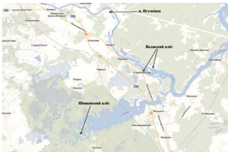
Рисунок 1. Иваньковское водохранилище Figure 1. Ivankovo reservoir

В Шошинском плесе р. Лама сильно изрезана и имеет большое число протоков глубиной