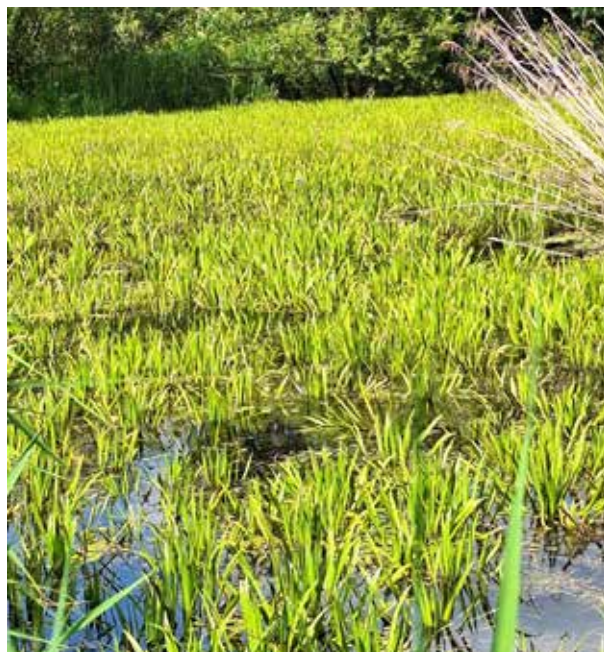
Рисунок 6. Монодоминантные заросли телореза Figure 6. Monodominant thickets of theloresis

единичных представителей ветвистоусых (отряд Cladocera) и веслоногих (отряд Cyclopoida). На телорезе их значительно меньше. Количественные показатели развития организмов зооперифитона, рассчитанные на единицу фитомассы, представлены в таблице. В погруженной растительности беспозвоночных обростателей (рдест) значительно больше, чем в прибрежно-водной (рогоз), а в зарослях телореза показатели численности и биомассы очень низкие.