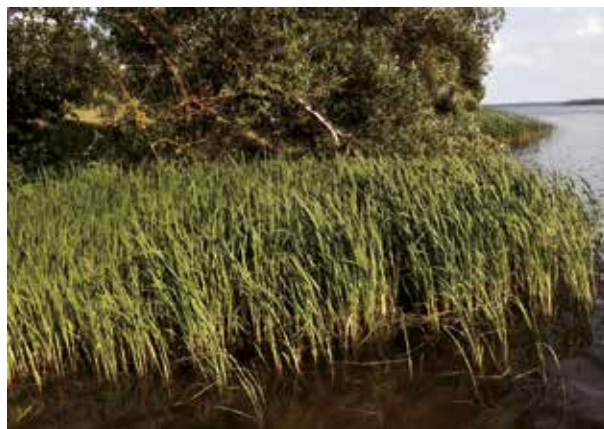
Рисунок 5. Правобережье Волжского плеса речной участок

Исследования организмов обростателей и скоблителей проводили на монодоминантных участках. На стеблях макрофитов обнаруживали хирономид (семейство Chironomidae), малощетинковых червей (отряд Oligochaeta), ручейников (сем. Trichoptera), пиявок (отряд Hirudinea), личинок водяных клопов (отряд Heteroptera), водяных жуков (отряд Coleoptera), стрекоз (отряд Odonata), поденок (отряд Ephemeroptera), брюхоногих моллюсков (класс Gastropoda),