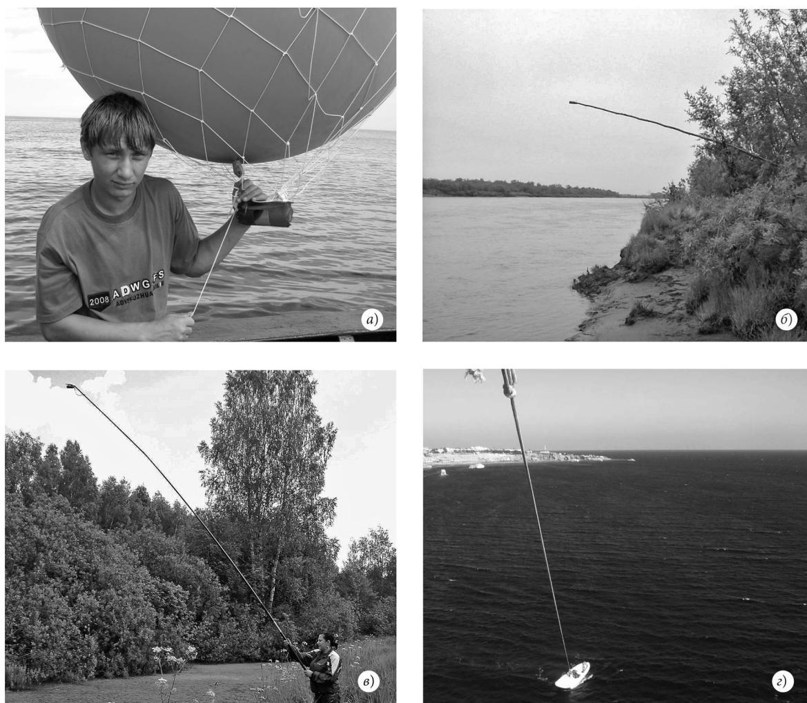
Рис. 1. Способы фотосъёмки рыб через поверхность воды: а — гелиевый шар с кассетой для фотоаппарата; б — наклонный шест над «тропой» анадромной горбуши; в — фотоаппарат на конце удильца; з — фотосъёмка с буксируемого парашюта

Автором измерены расстояния между рыбами в литорали и эпипелагиали на фотогра-