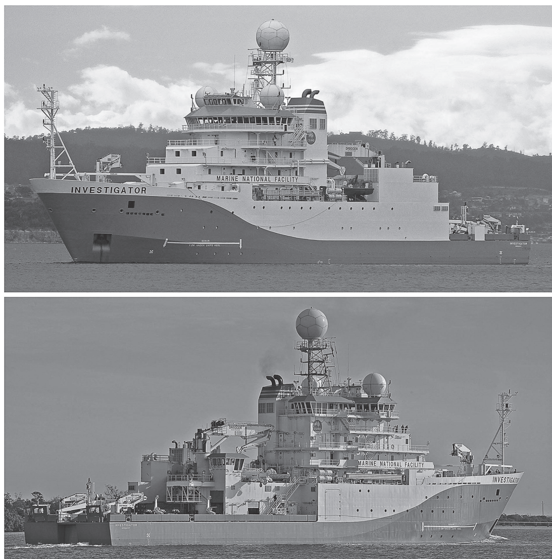
Рис. 1. Вид НИС Investigator по левому (сверху) и по правому (снизу) борту

Главные размерения нового НИС Investigator (рис. 1) представлены ниже: