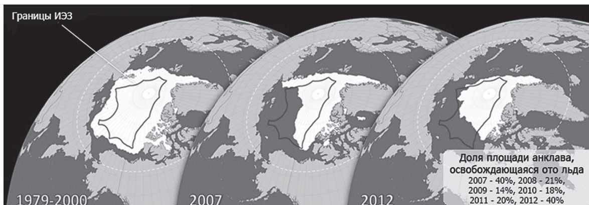
Рис. 1. Распространение арктической ледовой шапки по годам по данным фонда Rew

При этом исследования показывают, что скопления основных объектов промысла в Атлантическом секторе Северного Ледовитого