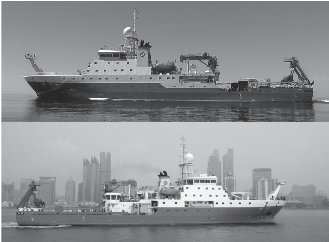
Рис. 2. Вид НИС «Ке Хуе» по левому (сверху) и по правому (снизу) борту