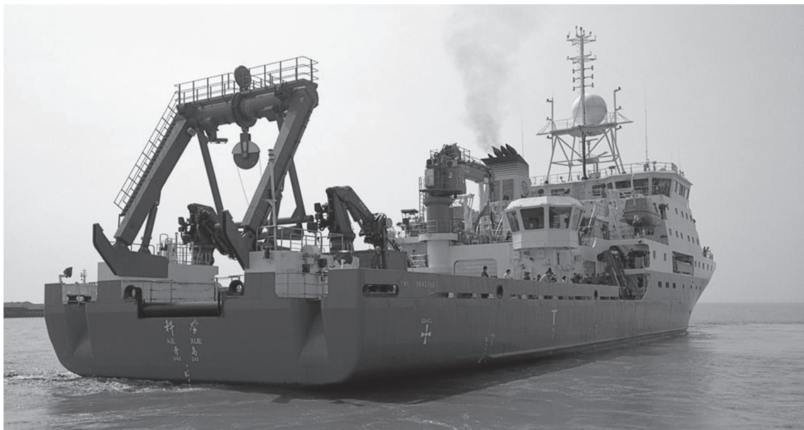
Рис. 4. Вид и расположение основных СПУ, установленных на кормовую часть и правом борту НИС «Ке Хуе»

Также большой объем занимают внутренние помещения научного назначения, расположение которых близко к принятому на британском НИС «James Cook» [Левашов, 2010] и которые распределены следующим образом: