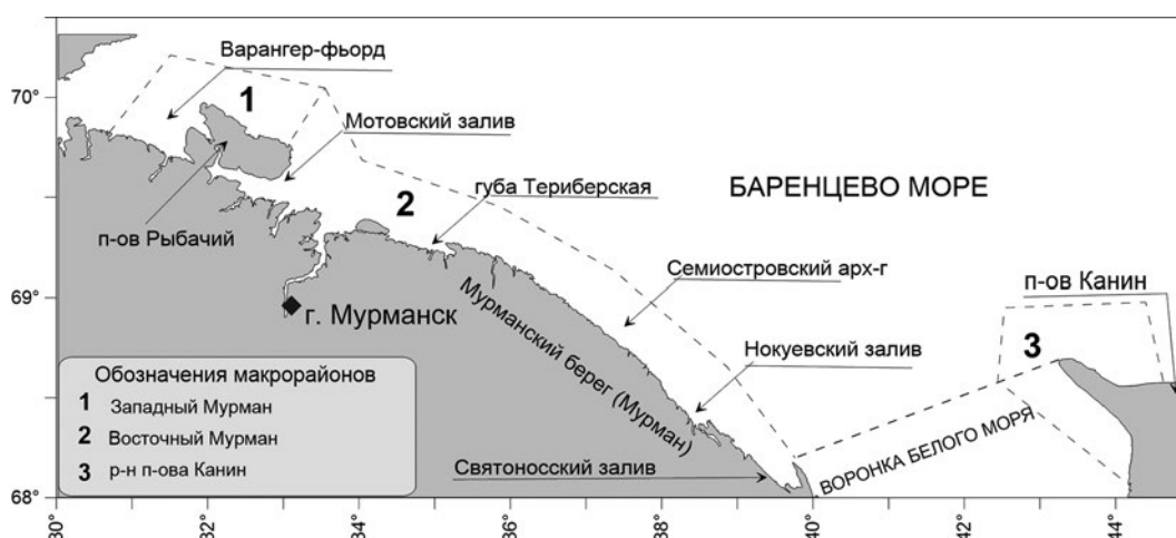
Рис. 1. Некоторые локальные участки и географические наименования, используемые в статье Fig. 1. Some local sites and geographical names used in the article

Современная структура скоплений камчатского краба достаточно хорошо изучена благодаря регуляр-