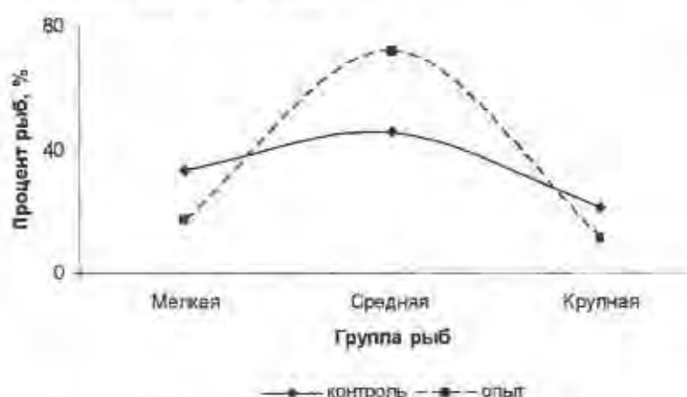
Рис. 1. Соотношение весовых групп личинок севрюги, перешедших на активное питание при различных условиях выдерживания.

Помимо этого, для определения лучшего варианта выдерживания, было проведено разделение полученной после перехода на внешнее питание молоди, на группы: мелкая, средняя, крупная. Во всех вариантах севрюга была разделена по группам одинаково. Анализ материала показал, что в опыте получен практически в два раза более низкий процент мелких и крупных особей, чем при внесении кормов в традиционные сроки по сравнению с контролем (рис. 1), средняя группа, соответственно была выше в 1,6 раза.