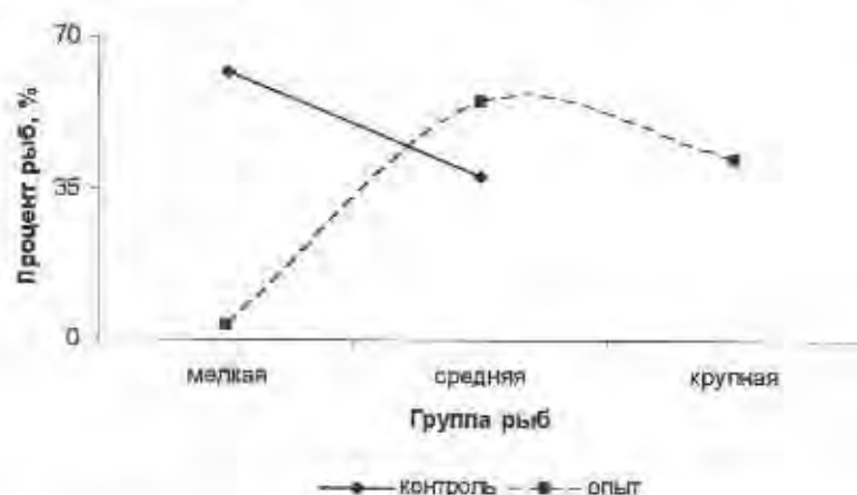
Рис. 4. Соотношение массы трехлеток севрюги, выращенной в различных условиях.

В конце данного периода проведена сортировка выращенной рыбы, на группы: мелкая (218-500 г), средняя (501-900 г), крупная (901-1 200 г) (рис. 4). Из материала видно, что в контроле нет особей, отнесенных нами к группе крупных особей. Выращивание в данном варианте проходило в пластиковых бассейнах, при низкой плотности посадки. Максимальная масса в конце третьего сезона выращивания у севрюги в контроле была 796 г, минимальная – 218 г, в опыте соответственно 1 200 и 440 г. Таким образом, севрюга не может использовать возможности своего потенциального темпа роста на третьем году жизни, если в предыдущем сезоне не были созданы комфортные условия развития. Установлено, что целесообразно включение в состав корма пробиотика «Биоплюс 2Б» и крови крупного рогатого скота.