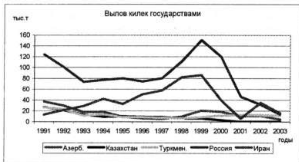
Рис. 1. Многолетняя динамика годовых уловов прикаспийских государств.