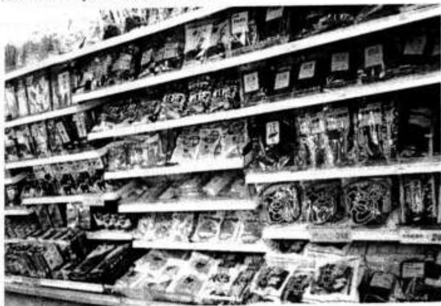
Рис. 2. Расфасованные по небольшим пакетикам сухие морские водоросли разных видов, собранные у побережья Японии, в супермаркете г. Кобе.

lomentaria , широко распространены не только в Корее и Японии, но и в российских водах Дальнего Востока, в том числе и на Камчатке. Некоторые из них, особенно морская хорда – C. filum , в разных районах Берингова моря образует высокую фитомассу, и, например, в районе о. Карагинский ее длина может достигать трех и более метров.