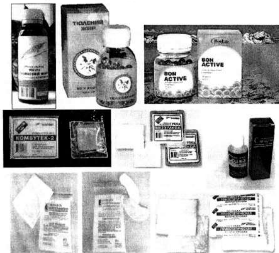
Рис. 6. Медицинские препараты, выпускаемые в России из жира тюленей и коллагена. Fig. 6. Healthcare products made of seal fat and collagen in Russia.

промышленного комплекса (НПК), в который войдут: ведущее научное учреждение ФГУП «МагаданНИРО», Администрация Магаданской области, крупные магаданские рыбодобывающие и перерабатывающие компании.