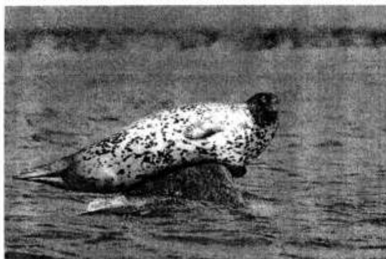
Рис. 3. Лапра.

пополнять объем нерестового запаса. С учетом этого, биомасса высвобождаемого от хищничества промыслового запаса рыб увеличится еще на 70-80 тыс. т. Этих объемов будет достаточно для работы 4-х крупнотоннажных рыболовных судов в течение календарного года. Целевое выделение и использование этих квот на развитие и поддержку возрождения морского зверобойного промысла может стать первым шагом к самокупаемости проекта. Именно поэтому, не только в силу экономической целесообразности, но и в целях соблюдения экологической сбалансированности в экосистеме Охотского моря, необходимо приложить все усилия для возобновления промысла настоящих тюленей.