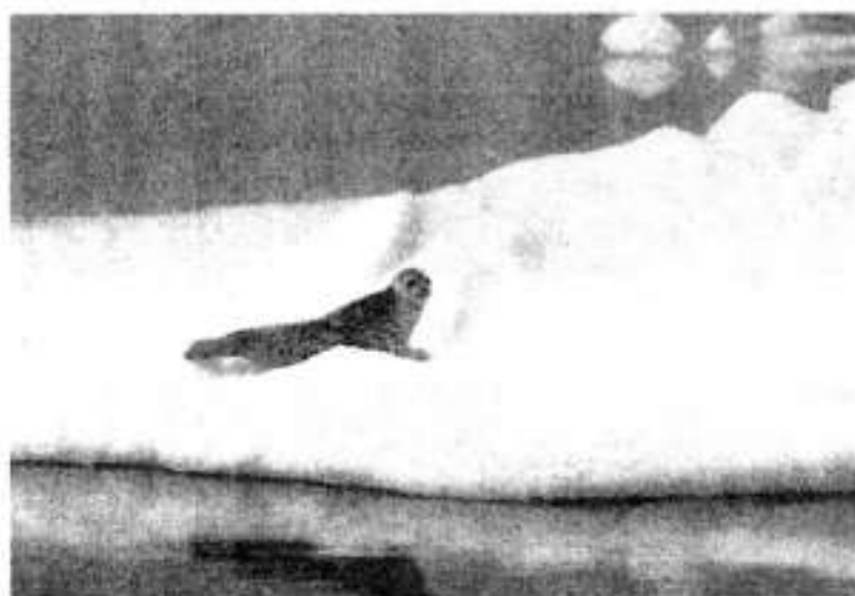
Рис. 2. Акиба.

При условии возобновления морского зверобойного промысла, согласно прогноза ОДУ (общий допустимый улов), в Охотском море планируется добыча четырех видов тюленей общим количеством 60 тыс. голов в год. Это акиба, ларга, крылатка и лахтак (рис. 2-5).