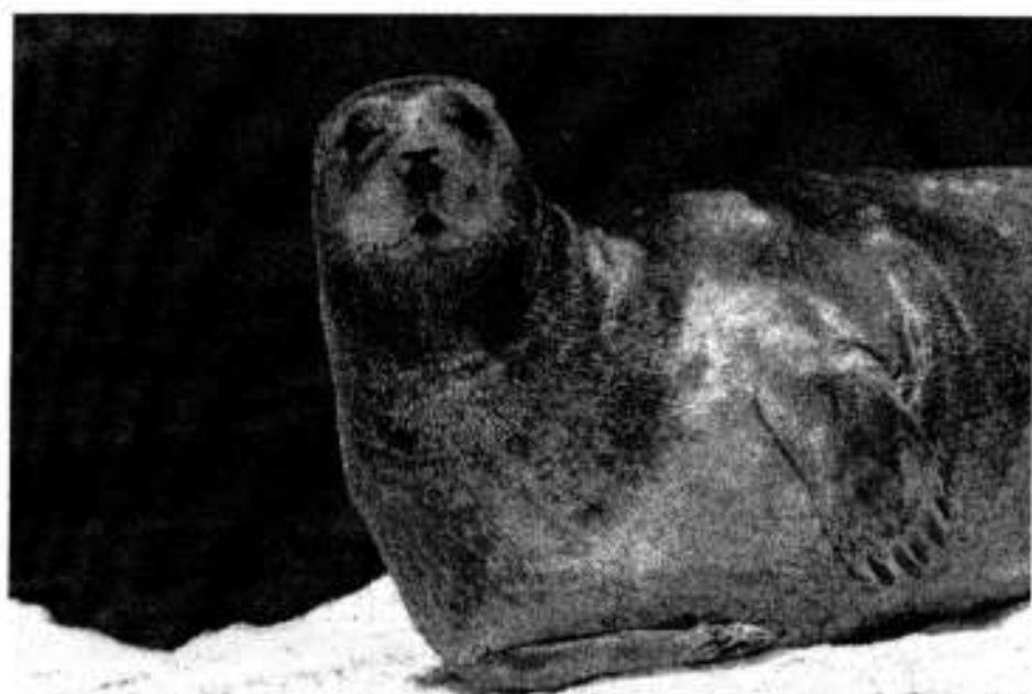
Рис. 5. Лахтак.