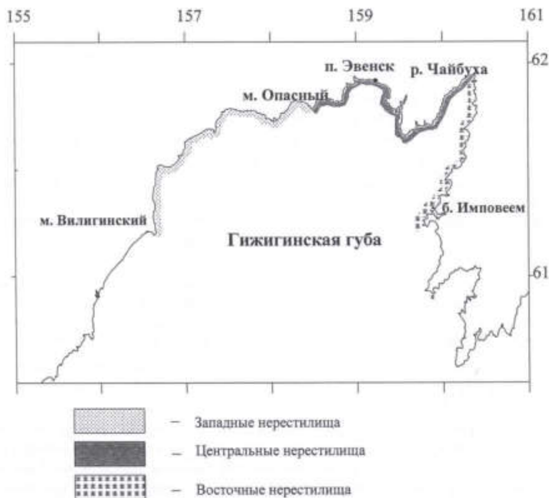
Рис. 1. Основные нерестилища гижигинско-камчатской сельди.

Особенности нерестовых подходов. В апреле-начале мая гижигинско-камчатская сельдь совершает преднерестовую миграцию из мест зимовки (район северо-западной Камчатки – северо-восточный склон впадины ТИНРО) к нерестилищам Гижигинской губы, которые условно делятся на три района: западный – от м. Вилигинский до м. Опасный, центральный – от м. Опасный до р. Чайбуха и восточный – от р. Чайбуха до бух. Имповеем (рис. 1).