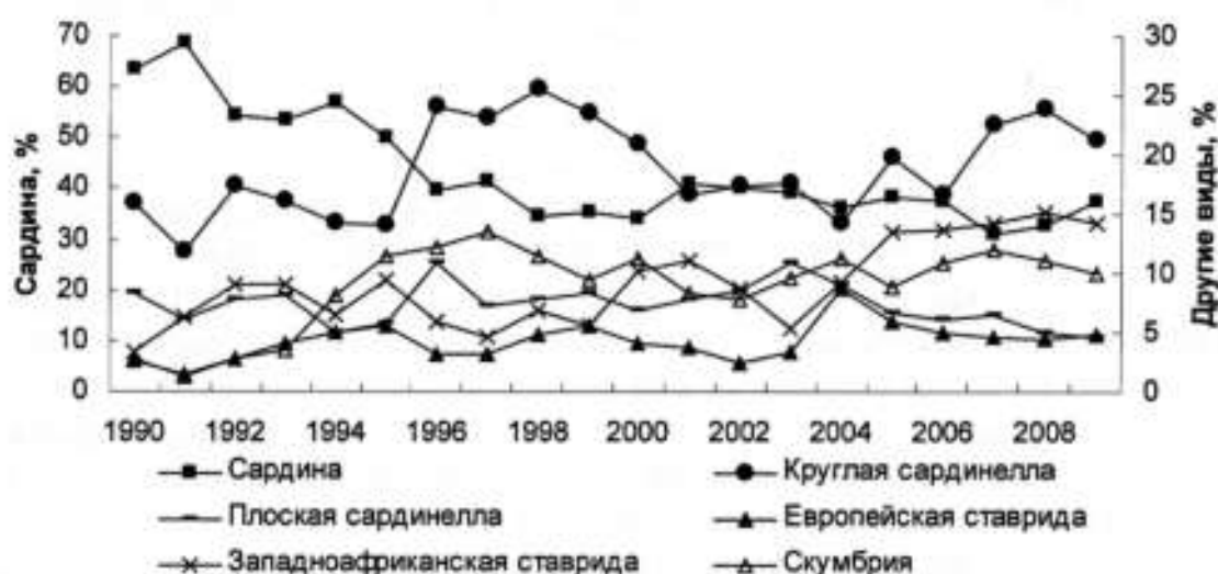
Рис. 2. Видовой состав общего вылова мелких пелагических рыб в экономических зонах Марокко, Мавритании, Гамбии и Сенегала, %.

Происходящие в настоящее время изменения в составе вылова связаны не столько с состоянием запасов, сколько с меняющимся соотношением между видами промысла. В экспедиционном лове, прежде осуществлявшемся преимущественно восточноевропейскими судами, с середины 1990-х годов все более значительную роль стали играть западноевропейские траулеры-процессоры. Основным объектом их внимания была сардинелла, сразу потеснившая в статистике уловов лидировавшую до того сардину (рис. 2). Еще больше сардинеллы добывается кустарным промыслом, масштабы которого растут. Особенно заметен рост вылова сардинелл сенегальским маломерным флотом, с недавних пор получившим круглогодичный доступ в мавританские воды. После выгрузки в африканских портах основная часть этой рыбы подвергается так называемой «традиционной» безотходной переработке. Засоленная и высушенная на углях рыба потребляется и экспортируется внутрь континента либо в сушеном, либо в измельченном до порошка виде.