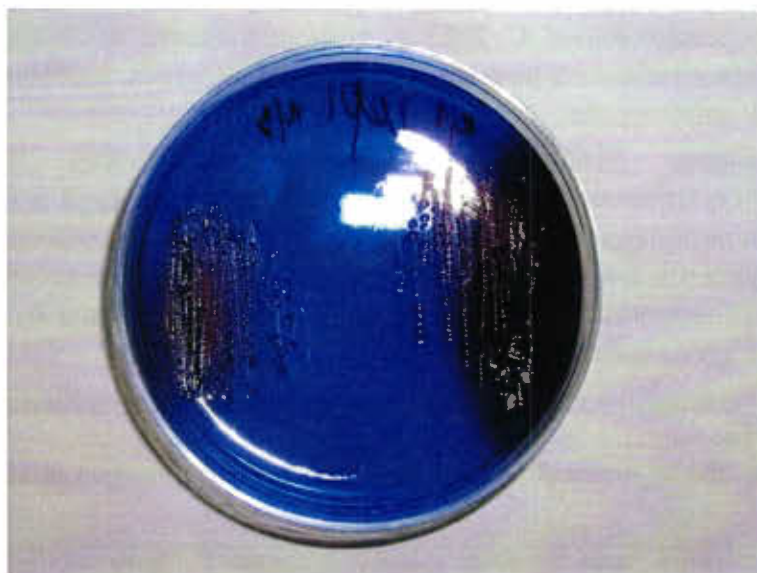
Рис. 2. Коричневый пигмент вокруг колоний A. salmonicida на агаре с добавлением бриллиантового синего (СВВ).

Fig. 2. Brown pigment around colonies A. salmonicida in Coomassie Brilliant Blue (CBB) agar.