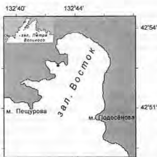
Рис. 1. Карта-схема района исследований и сбора материала в зал. Петра Великого (Японское море).

Материалом для исследования послужили одиночные мидии и модиолусы из зал. Восток (зал. Петра Великого, Японское море), собранные летом 2002 и 2006 гг. на глубине 0,5-1,5 м с крупных валунов и скал на участке дна, представляющем собой умеренно защищенное побережье выступающего мыса, относящееся к третьему биономическому типу сублиторали, характеризующееся 3-й степенью прибойности (Лукин, Фадеев, 1982) (рис. 1). Сбор одиночных особей позволил нейтрализовать фактор плотности, который является одним из решающих при формировании формы раковины (Seed, 1968).