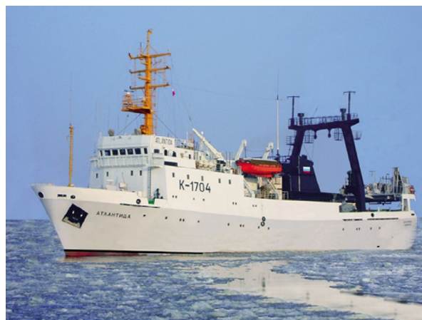
Рис. 3. Судно СТМ «Атлантида».

В сезон 2019–2020 гг. Российская Федерация возобновила ресурсные исследования криля в АЧА, реализованные Росрыболовством в 69-м рейсе СТМ «Атлантида» (рис. 3). Комплексные экспедиционные исследования криля в АЧА направлены на проведение акустической съемки, сопровождаемой широким комплексом сбора данных по окружающей среде, в том числе, выполнением гидрометеорологических, океа-