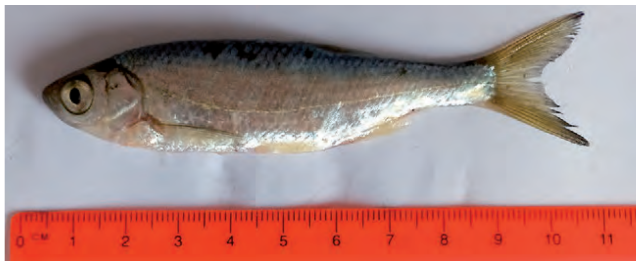
Рисунок 2. Уклейка Alburnus alburnus (Linnaeus) – типичный обитатель непроточных и слабопроточных водоемов Кабардино-Балкарии

Характерные признаки отловленных нами уклек, в целом, соответствуют приводимым