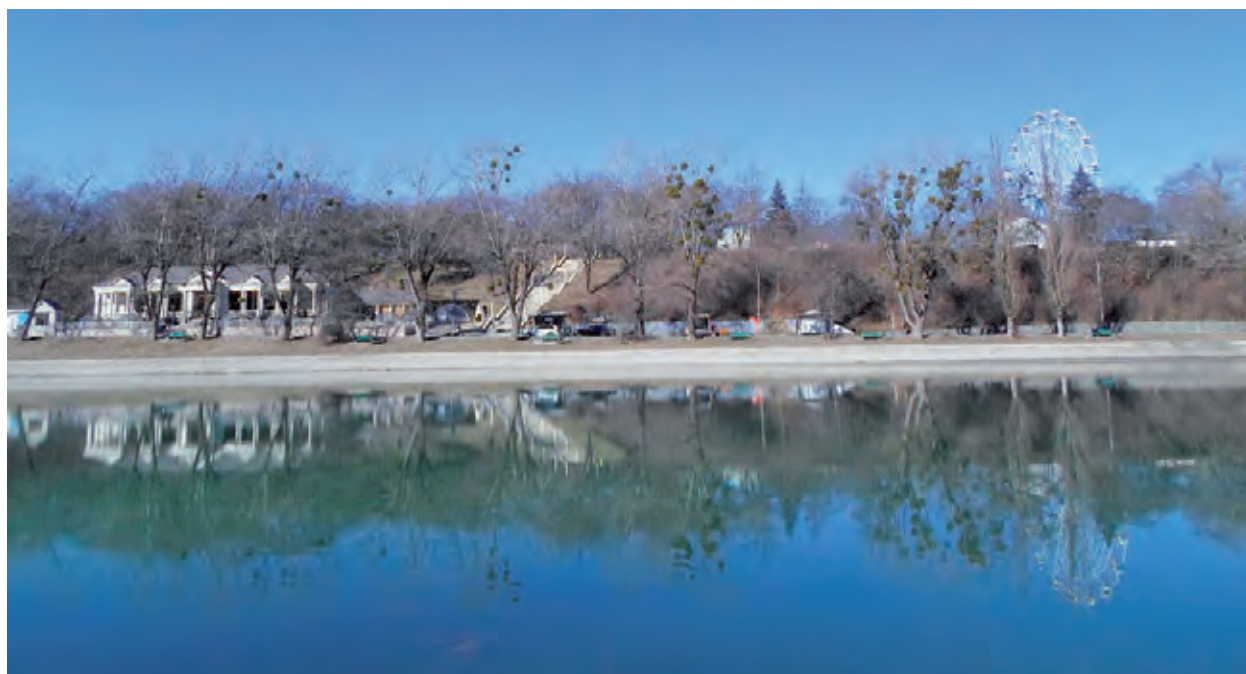
Рисунок 1. Центральный пруд комплекса накопителей ТРЭК города Нальчик

Материалом послужили собственные уловы. Отлов уклекек производился осенью 2025 г.