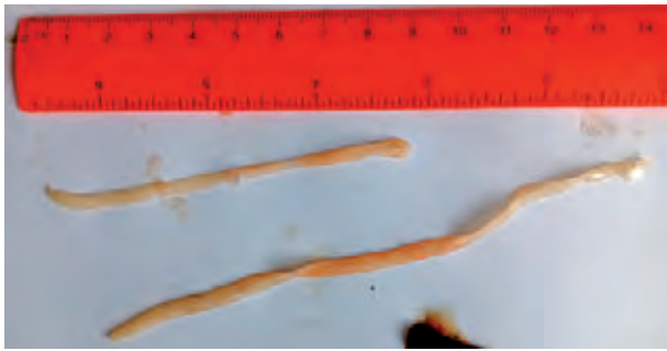
Рисунок 5. Личинки паразитических червей Ligula intestinalis Linnaeus из уклеек